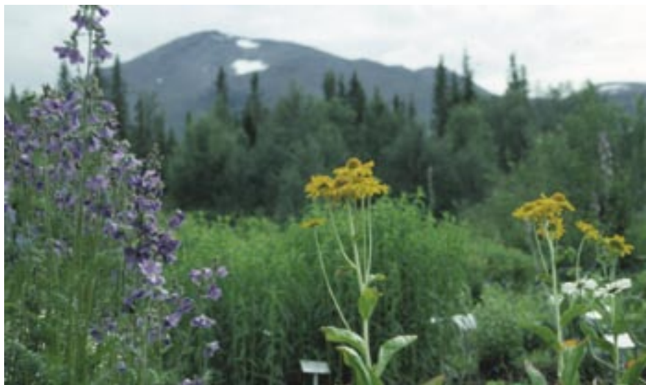
Blågull ( Polemonium caeruleum ) och gullstake ( Helenium hoopesi ) i Enaforsholms försöksträdgård med Storsnasen i fonden.

bönderna i Handöl. Några år senare förvärvade de själva mark i området och 1877 ägde de hela Enaforsholm. De lät bygga ett sågverk vid Lillån och flyttade 1879 permanent till Holmen, i god tid inför järnvägens, den jämtländska tvärbanans, invigning 1882. På Enaforsholm öppnade de en lanthandel, i nuvarande Akademiflygeln, och drev också både en godshantering i egen firma och viss