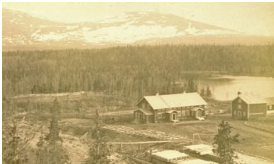
Enaforholm våren 1899 (troligen). Trädgårdsanläggningarna skymtar bakom huvudbyggnaden.

gästers räkning under somrarna 1907–1908. Då hade emellertid sanatorieverksamheten redan avstannat och rummen hyrdes istället ut till vanliga fjällturister. Någon egentlig mathållning ägde heller inte längre rum för anläggningens gäster.