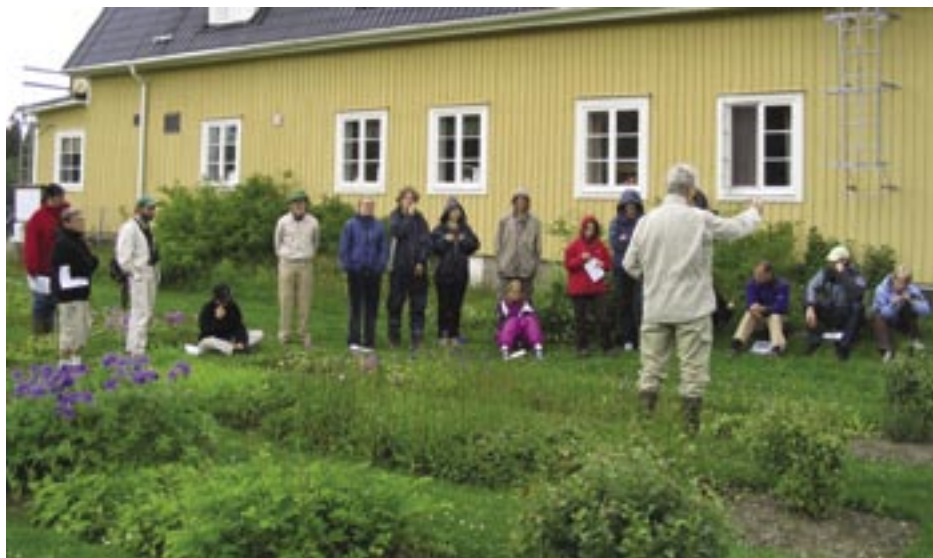
Demonstration i trädgården under Enaforsholmskursen 2004.

I Enaforsholms Fjällträdgård uppdateras löpande en Plan med växtförteckning och i en brevlåda på plats kan också den mest aktuella Växtförteckningen hämtas. Denna växtförteckning och andra trädgårdspublikationer är också tillgängliga för nedladdning via KSLAs hemsida, www.ksla.se .