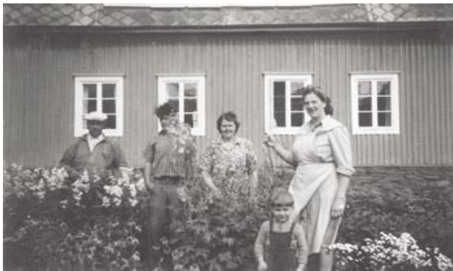
Enaforsholms försöksträdgård 1951. Fylldblommigt älggräs, trädgårriddarsporre, fylldblommig vitpytta med flera växter.

ett fullständigt misslyckande", meddelade Gréen. Utfallet av försöksodlingarna av perenner (93 stycken) och prydnadsbuskar (61 stycken) var dock ett annat och mycket positivt. Det känner vi genom en omsorgsfull redovisning i Stora Trädgårdsboken (1957). Cirka 17 olika perenner och 15 olika prydnadsbuskar med ursprung i Gréens planteringar påträffas fortfarande i trädgården idag.