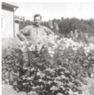
Filipendula ulmaria 'Plena'. 1951.