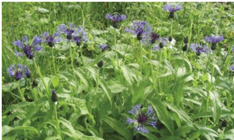
Bergklint (Centaurea montana), odlad av Sven Gréen och kvar i trädgården än idag.

Den sjätte trädgården (1991–) utgörs av dagens trädgård på Enaforsholm. 1991 övertogs ansvaret för trädgårdens skötsel och