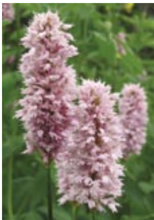
Bistorta officinalis 'Superba'.

båda 1898. Ett konsortium bestående av sju personer, med initiativtagaren Olaf Pedersen i spetsen, tog över Enaforholm och bildade Enafors Aktiebolag år 1900, med en inriktning mot jordbruk, pensionatsverksamhet, färjetrafik, trävaruhantering och