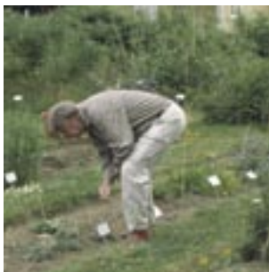
Professor Börje Lövkvist.

Den femte trädgården (cirka 1956–1990) utgör en utveckling av den föregående. I början–mitten av 1950-talet övertogs ansvaret av professor Börje Lövkvist (1919–1994) på Alnarp, som sedan decenniets början knutits och knutit sig till flera olika forsknings- och undervisningsaktiviteter rörande klimat, ekologi, vegetation och hårdighet i västra Jämtland, delvis med ett stöd från KSLA. År 1965 preciserades detta: "Undersökning över tillväxt, blomning och förvedning hos hortikulturellt material och vildväxande från speciella utländska områden i jämförelse med svenskt vildmaterial från selektionsområden med kända klimatologiska och meteorologiska data." Under 1950-talet utvidgades trädgården till mer än dubbel storlek (vilket är lika med dagens utsträckning). Ett av de