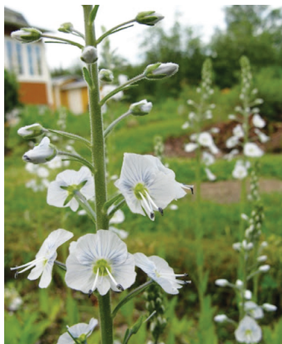
Porslinsveronika ( Veronica gentianoides ) blommar i vitt i augusti.