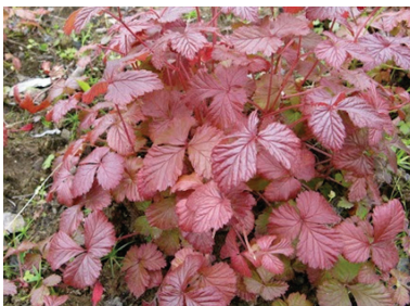
I september kommer också härliga höstfärger, som här på allåkerbäret ( Rubus arcticus ssp. x stellarcticus ).

Det finns förstås så många fler växter att betona, men våra absoluta favoriter är nog trots allt ändå framförallt två: Den ena är sibirisk vallmo ( Papaver croceum ), perennen som funnits i trädgården sedan 1968 och som kan konstnären att vara i blom, i knopp och överblommad på samma planta. Denna nätta, gul- eller orangefärgade blomma tycks alltid komma igen; den sprider sig villigt men inte ogräsartat, och den kan skådas under alla växtsäsongens månader. Vår andra favorit är stjärnflockan ( Astrantia major ) som slår ut i juli med gräddrosa halvklotformade blomflockar på gracila stjälkar. När blomningen är över kan man fortsätta beundra stjärnflockans vackra blomställningar.