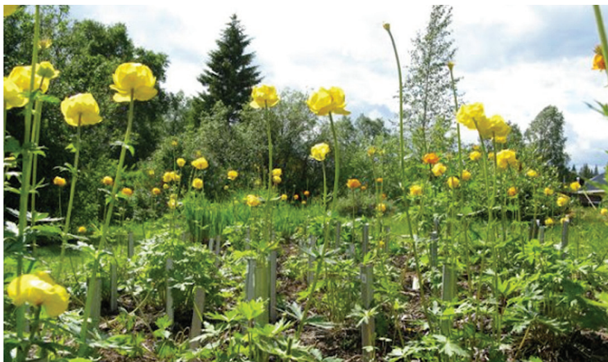
Smörbollarna ( Trollius spp.) blommar för fullt i bakre delen av trädgården i juni-juli.

Bilderna på framsidan visar från vänster ovan riddarsporre ( Delphinium sp.) och kaukasisk näva ( Geranium platypetalum ) samt från vänster nedan stjärnflocka ( Astrantia major ), sibirisk vallmo ( Papaver croceum ) och smörbollor ( Trollius x cultorum cv.)