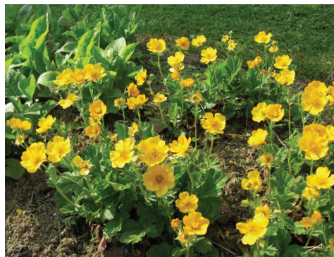
Bergnejlikroten (Geum montanum) blommar tidigt i juni och fungerar bra som marktäckare.

I juni är nog trädgårdens höjdpunkt de många sorterna av smörbollar som blommar rikligt i bakre delarna av trädgården i färger från ljusgult till varmt orange. Vi vill också lyfta fram den röda nejlikroten och den gula bergnejlikroten ( Geum spp.) som fungerar utmärkt som låga marktäckare i rabatten. Kommer man i tid får man också se några av vårlökarna blomma, kanske den vita påskliljan Narcissus pseudonarcissus 'Mount Hood' eller kungsängsliljan ( Fritillaria meleagris ) med sina lilaröda rutmönstrade blommor.