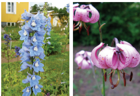
Riddarsporre t.v. och krollilja t.h. i full blom i augusti.

Augusti är de resliga perennernas tid: i blått, lila och rosa blommor riddarsporrar, krollilja ( Lilium martagon ) och strandveronika. I gult går den enkla men så klart lysande munkrenfanan ( Tanacetum vulgare ), det kraftigväxande strålögat ( Telekia speciosa ), och trädgårdens samling av stånds ( Ligularia spp.).