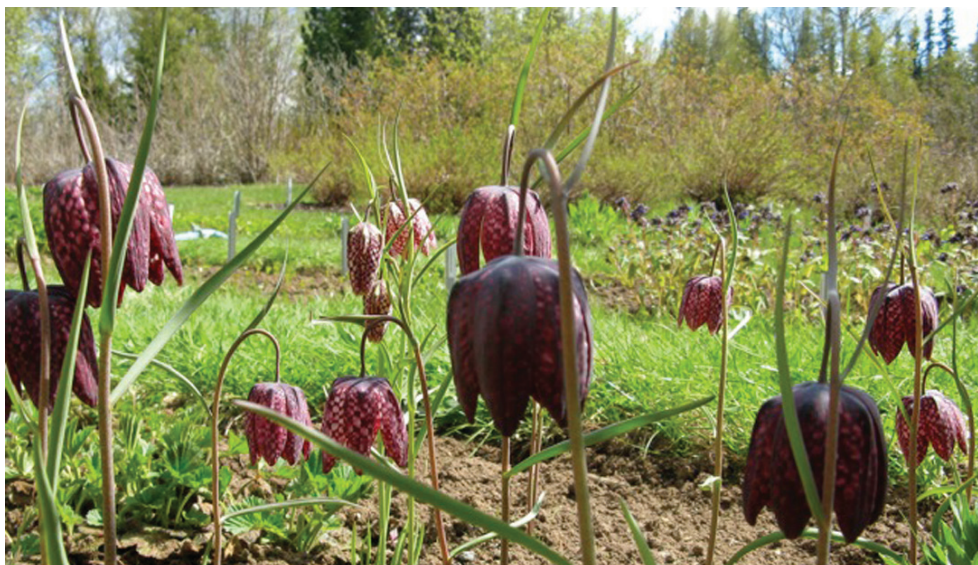
Kungsängsliljan ( Fritillaria meleagris ) blommar i det smått ovanliga mönstret, rutigt.