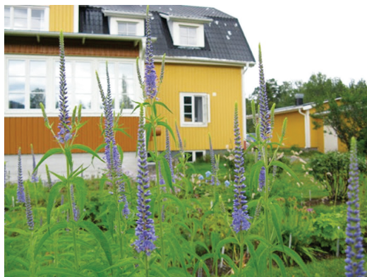
Bakom Enaforsholms fjällgård breder fjällträdgården ut sig. Här blommar bl.a. strandveronikan ( Veronica longifolia ) i juli.